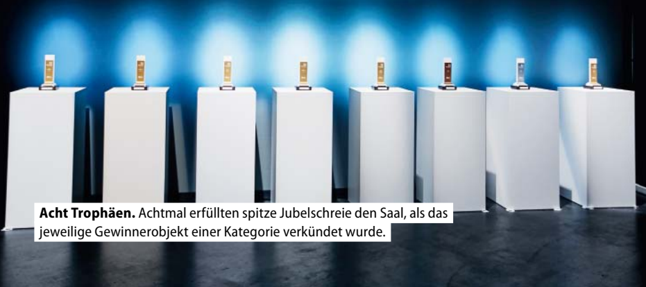
Acht Trophäen. Achtmal erfüllten spitze Jubelschreie den Saal, als das jeweilige Gewinnerobjekt einer Kategorie verkündet wurde.

Gemeinsam habe man, so Werner Hansmann weiter, in der Vergangenheit häufig neue Wege beschritten und auf diese Weise den modernen Trockenbau geprägt. Gemeinsam gelte es nun gleichermaßen, die spannenden Herausforderungen der Gegenwart und Zukunft tatkräftig anzunehmen. Mit der Innovation „Rigips Habito“ eröffneten sich gerade für das Tro-